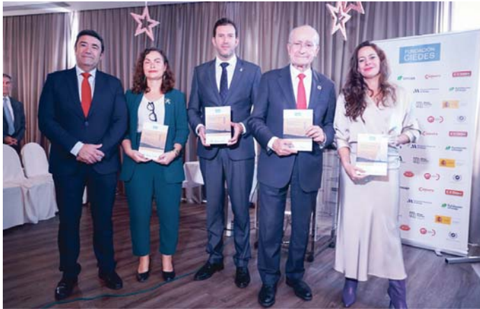
Presentación del nuevo barómetro sobre la actividad inversora extranjera en Málaga. AYO. MÁLAGA

aceleración global, el 40 % de estas empresas reportaron un crecimiento en sus inversiones durante 2024, y un 33 % en su facturación.