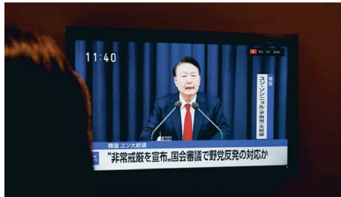
El presidente surcoreano, Yoon Suk-yeol, anunciando la declaración de la ley marcial por televisión.

El anuncio de Yoon se produce después de que el PD aprobara sin contar con el apoyo del gobernante Partido del Poder Popular (PPP) unos presupuestos generales para