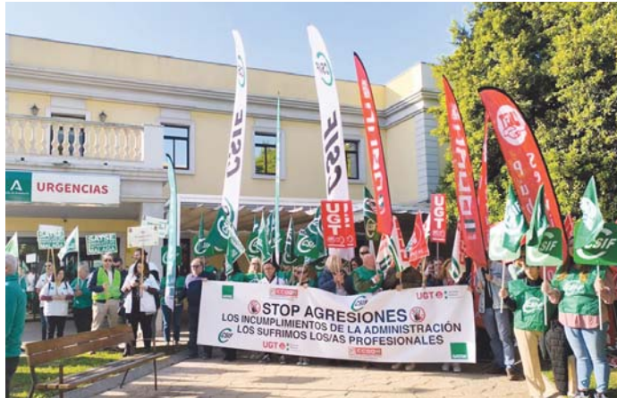
Siguen las protestas contra las agresiones al personal profesional de la sanidad pública. CSIF

Hasta junio, a nivel andaluz se han contabilizado un total de "930 agresiones", aunque se trata de números "falsos", porque "si se denunciara todos los insultos y vejaciones, las cifras se multiplicarían por mucho". "Esto es una prueba irrefutable", ha dicho Ruiz, de que la "inacción" de la Junta y el "incumplimiento de los pactos firmados, hacen un caldo de cultivo para las agresiones". El