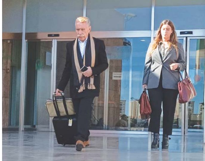
A la izquierda, el mediático abogado a su salida de los juzgados de Málaga (archivo). VM

La Sala de Apelación del TSJA deberá resolver además sobre la condena impuesta al joven que adquirió el ácido sulfúrico con el 98% de grado