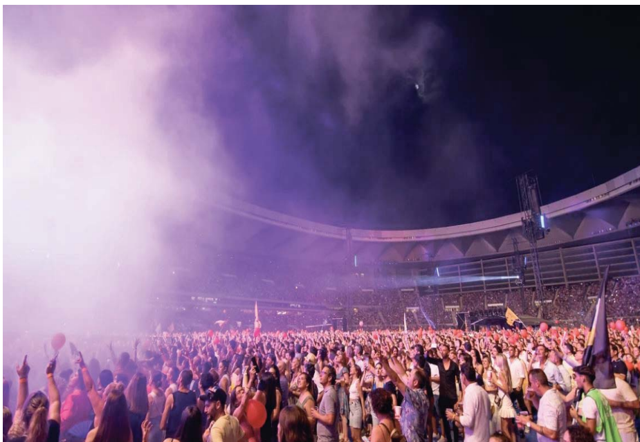
Imagen de archivo de un concierto en el Estadio de la Cartuja de Sevilla durante el verano.

Aumentan también los datos en música clásica. Comparando los resultados