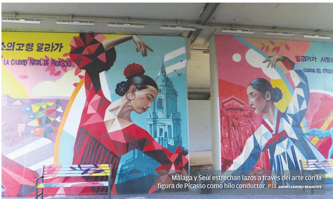
Málaga y Seúl estrechan lazos a través del arte con la figura de Picasso como hilo conductor P13 ANDRÉS SÁNCHEZ BRAJIN/EFE

DESEMPLEO De nuevo el sector servicios provoca en la provincia malagueña un incremento de 164 parados más el pasado mes CAPITAL El paro ha descendido tanto en el cómputo mensual como en el interanual de 2023 a 2024 NEGATIVO La provincia de Málaga ha sido en noviembre la única en Andalucía donde ha crecido el paro