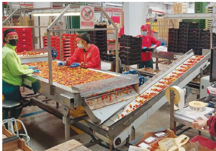
Trabajadores de una cooperativa en una imagen de archivo.

Así, Málaga ha sumado en noviembre 164 nuevos parados, alcanzando los 120.070 desempleados. Pero, como han destacado desde la Confederación de Empresarios de Málaga (CEM), son 12.540 menos que hace un año. Por sectores, servicios cerró el pasado mes con un incremento de 319 parados y las personas sin empleo anterior, de 154. En la situación opuesta, registraron descensos en el número de desempleados la construcción (-146), la agricultura (-109) y la