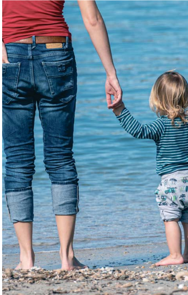
Foto de archivo de una madre en la orilla de una playa.

“Criar es caro, lo que influye en la decisión de tener un hijo” en España, donde nacen 1,16 hijos por mujer, la tasa más baja de toda Europa, remarca este estudio, que calcula el gasto que deben enfrentar las familias en las distintas etapas de la vida de sus hijos